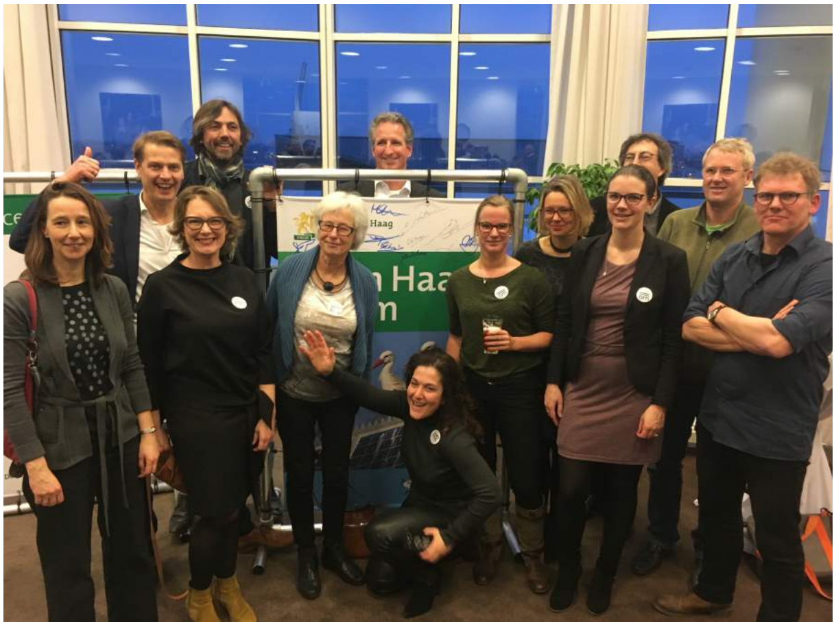
Den Haag= om, leden van 070Energiek tekenen contract met de gemeente.

Het bestuur van Haagse Stroom zal na de Algemene Ledenvergadering van 2018 (op 19 april) van start gaan en daarna de plannen voor 2018 en verder gaan uitwerken. Het bestuur heeft de ambitie om te groeien met het ledenaantal en om samen met de leden de stad warm te maken voor lokale opwek van groene stroom. Ze willen de vaart erin houden en staan te trappelen om te beginnen!